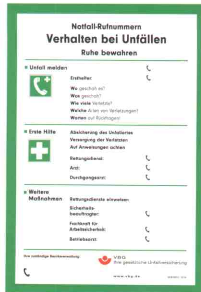
Vordrucke gibt es auch unter: www.vbg.de

Zur ordnungsgemäßen Führung einer Golfanlage gehört ferner das Vorhalten eines Spritztagebuches und eines Gefahrstoffverzeichnisses, für die der DGV-Umweltberater Vordrucke bereithält, sowie entsprechende Unterweisungen der Mitarbeiter und der Aushang von Arbeitsanweisungen, wie es beispielsweise im Marine Golf Club Sylt e.G. gehandhabt wird.